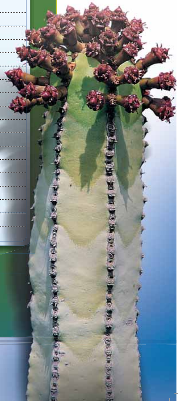
La imagen del cactus está un poco ampliada.