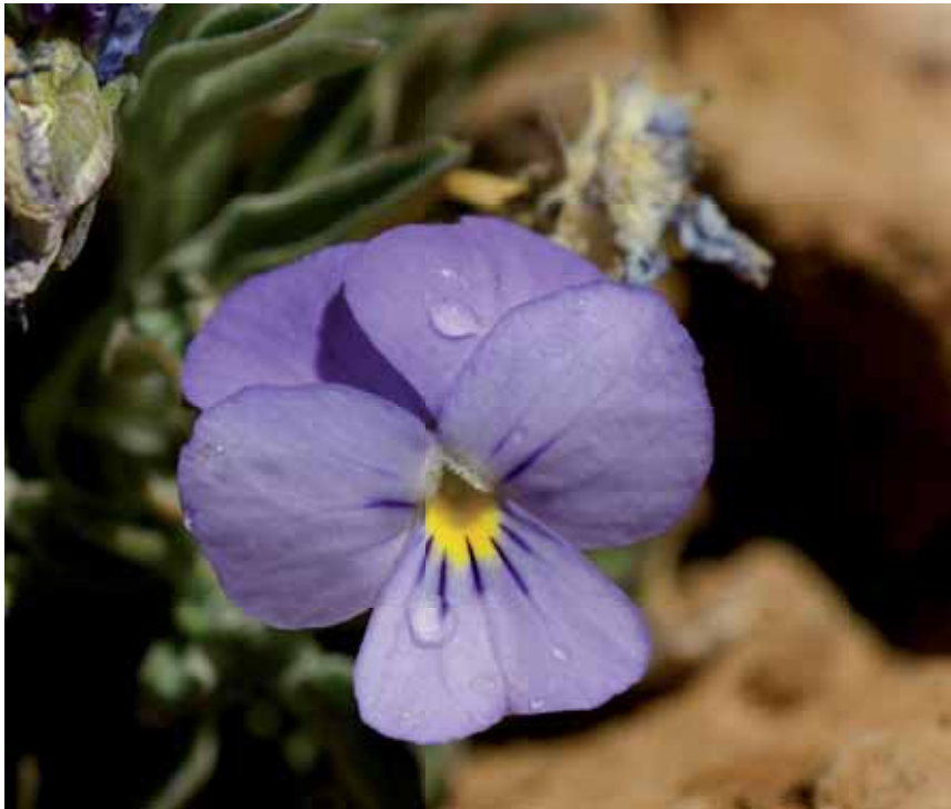
Violeta del Teide ( Viola cheiranthifolia ), un endemismo de Tenerife.

estar sometidas a fuertes amenazas, característica ésta que hoy ya no se considera imprescindible 15 . Los puntos calientes informan sobre dónde están las zonas que acumulan mayor valor patrimonial desde el punto de vista de la biodiversidad. Su delimitación es una tarea preferente para una adecuada ordenación territorial, que solo muy rara vez se ha abordado y, por lo general, a una resolución inadecuada 16 .